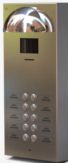
Dørtableau med kamera, tryk i dobbeltrække med graveret kobber skilte, halvmånelampe