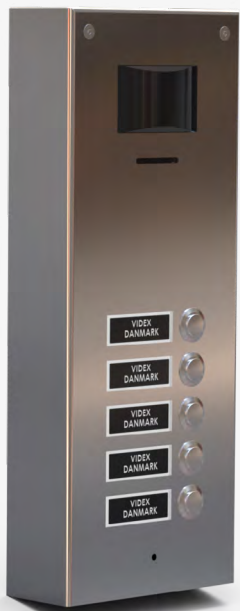
Dørtableau med kamera og tryk i enkelt række