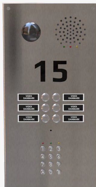
Dørtableau med kamera, tryk i dobbeltrække, kodetastatur og graveret husnummer