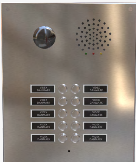
Dørtableau med kamera og tryk i dobbeltrække