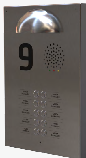
Dørtableau med tryk i dobbeltrække med graveret rustfritålskilte, halvmånelampe og graveret husnummer