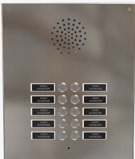
Dørtableau med tryk i dobbeltrække