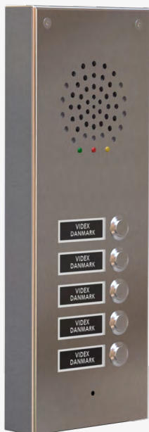
Dørtableau med tryk i enkelt række