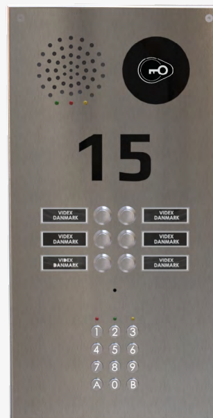
Dørtableau med tryk i dobbeltrække, kodedastatur, ADK og graveret husnummer